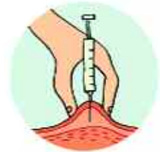
FIGURA 1. INYECCIÓN SUBCUTÁNEA

Hay varias formas de administrar los medicamentos: oral, rectal, cutánea (sobre la piel), intranasal, intravenosa, intramuscular y subcutánea.