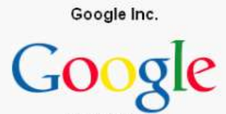
Logotipo de Google

En abril de 2007, Google compró DoubleClick 13 , una empresa especializada en publicidad en Internet, por 3.100 millones de dólares. Este mismo mes, Google se convirtió en la marca más